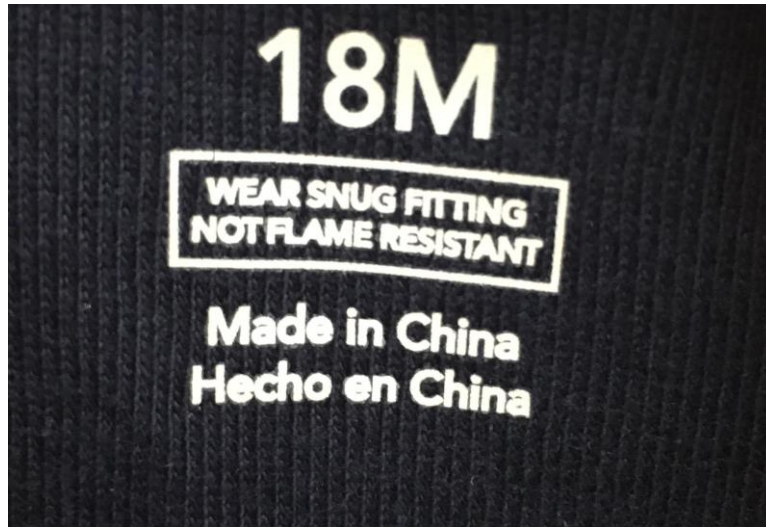
Figura 1 - Las prendas ceñidas de dormir también deben llevar una etiqueta justo bajo la talla ubicada en el centro de la parte trasera de la prenda.

Las prendas ceñidas de dormir deben cumplir con todos los requerimientos de Inflamabilidad de textiles para prendas (16 CFR 1610) o Película de Vinilo (si aplica).