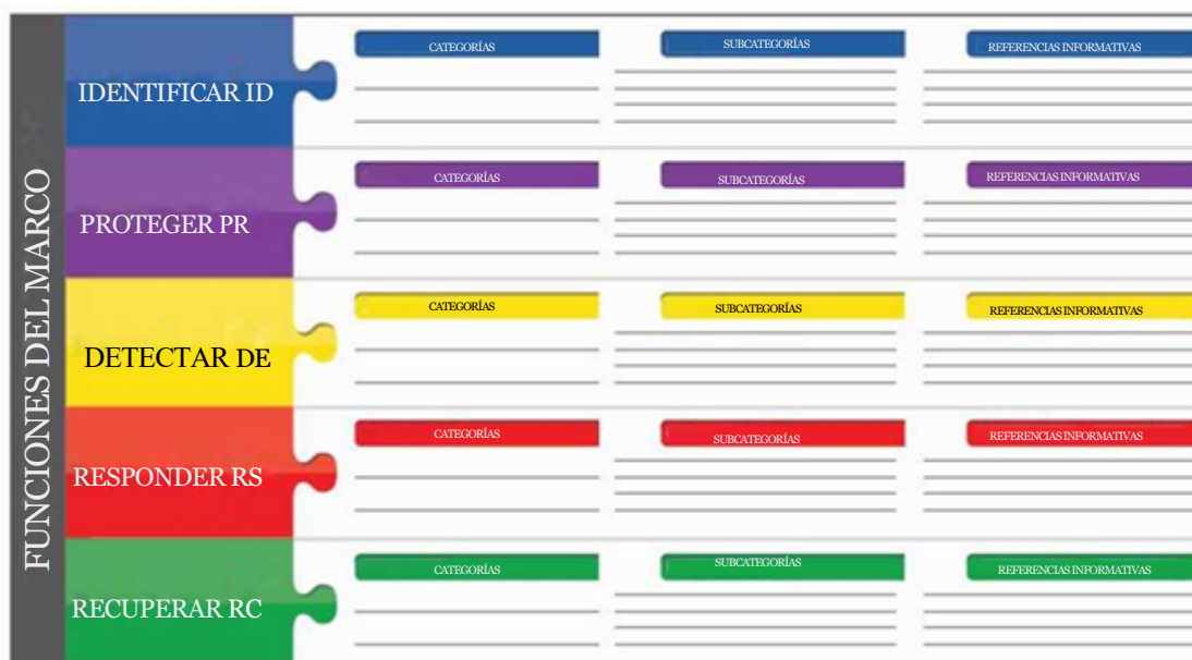
Figura 1: Estructura del Núcleo del Marco

El Núcleo del Marco proporciona un conjunto de actividades para lograr resultados específicos de seguridad cibernética y hace referencia a ejemplos de orientación en cómo lograr dichos resultados. El Núcleo no es una lista de verificación de las acciones a realizar. Este presenta los resultados clave de seguridad cibernética identificados por las partes interesadas como útiles para gestionar el riesgo de seguridad cibernética. El Núcleo consta de cuatro elementos: Funciones, Categorías, Subcategorías y Referencias Informativas, representadas en la Figura 1 :